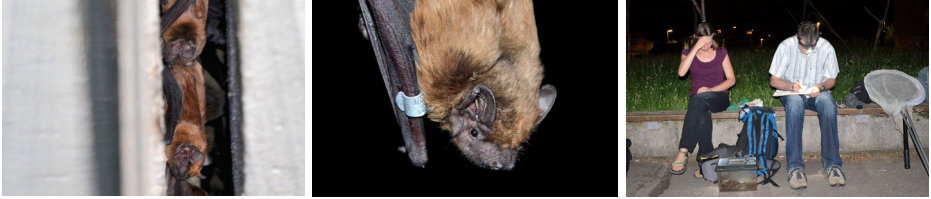
SLIKA 2. Navadni mračniki v reži bloka na Bratovševi ploščadi in njihovo merjenje.

c) Jesenski pregled nekaterih potencialnih območij zatočišč netopirjev naj bi bil namenjen ponovnemu preverjanju znanih zatočišč navadnih mračnikov in po možnosti iskanju novih.