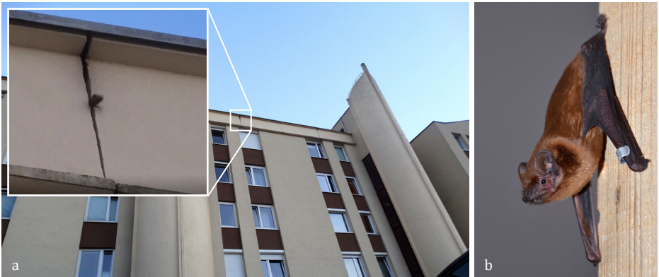
SLIKA 3. a) Kumrovška ulica in navadni mračnik, ki se ravno pripravlja na izlet, b) navadni mračnik označen z obročkom.

a) V stavbi strojne oz. računalniške fakultete pri pregledu z Jasmino Kotnik nisva potrdila prisotnosti navadnih mračnikov, smo pa te potrdili na Kumrovški (Slika 3a) in na Bratovševi ploščadi. Slednje je bila tudi edina množična akcija društva, saj so bili pri ostalih udeleženi le redki. Imeli smo neverjetno srečo, saj smo se lahko z obema lastnikoma stanovanj, najbližjih zatočiščema mračnikov dogovorili za obisk. Z obeh mest smo uspešno ulovili nekaj mračnikov in z malim razočaranjem ugotovili, da je šlo samo za samce te vrste, torej razmnoževanje pri nas še ni dokazano. Neverjeten pa je bil tudi izredno pozitiven odziv mimoidočih ljudi, ko smo na ulicah opazovali izletavanje in merjenje netopirjev.