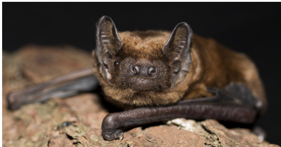
SLIKA 1. Navadni mračnik ( Nyctalus noctula ).

BatLife Europe je v drugem letu izvajanje akcije BoY (Bat of the Year) za netopirja leta proglasil navadnega mračnika ( Nyctalus noctula ). Splošnih podatkov o sami vrsti (Sliki 1 in 5) v tem prispevku ne boste našli, saj obstaja na to temo kar nekaj člankov in drugih prispevkov. Obči pregled razširjenosti vrste v Sloveniji podaja Zupančič (2009), Hočevar (2009a, b) je raziskoval predvsem zatočišča te vrste v Ljubljani, sam pa sem letos napisal prispevka, ki dodatno osvetlujeta stanje poznavanja te vrste pri nas (Presetnik 2016a, b). BoY je, tako kot podobne prireditve, namenjen seznanjanju javnosti (oz. prikladen izgovor, da lahko spet težimo z netopirji), pa tudi aktivaciji članstva. Razlog za sledeče poročanje je torej predvsem predstavitev, kaj smo letos naredili za navadnega mračnika.