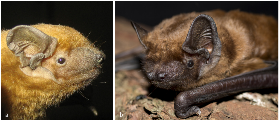
SLIKA 5. a) Portret navadnega mračnika ( Nyctalus noctula ), b) za mračnike je značilen ušesni poklopec v obliki gobe.